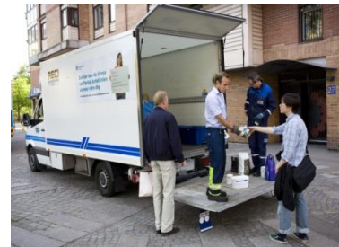
Miljöstation, Samlaren och Farligt Avfall-bil